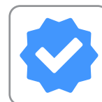
Vendita di soluzioni digitali