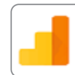
IQ di Google Analytics