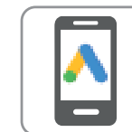
Publicità per il mobile